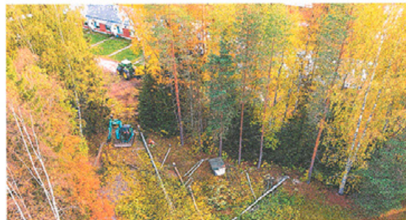
Suuret puut säästettiin.

Katsomo nousee samaan paikkaan, missä vanhakin, jo tiensä päähän tullut avokatsomo oli. Paikka on Katvalan päärakennuksen ku-