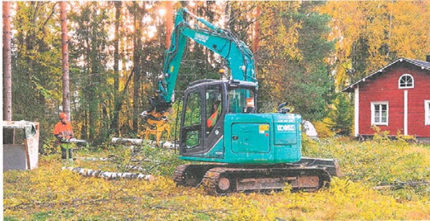
Uuden katsomon teko alkoi puiden kaadolla.