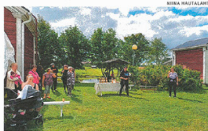
Karvoskylän Hovirannan avajaisissa väkeä riitti.

metsään kotalaavu. Ohjeistus laavulle on Koskenperän lavalta.