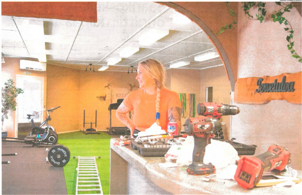
Entisen näkökeskuksen paikalle remontoiduissa tiloissa alkaa olla pientä hienosäätöä vaille valmista.