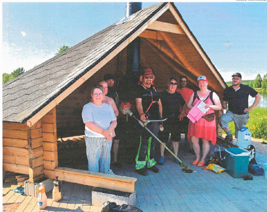
Yksi kökkäporukalla rakennetuista retkeilykohteista on Haikaran Sikorannalla sijaitseva laavu.