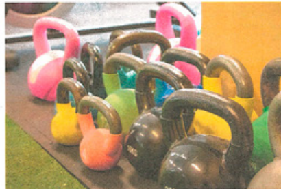
Vapaiden painojen lisäksi kuntosalilta löytyy laitteita sekä tilaa toiminnalliselle harjoittelulle.