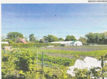
De Viermarkenin "hoivatila" Twenten alueella Hollannissa tarjoaa päivätöitä muun muassa mielenterveyskuntoutujille.

KESKIPISTE ja Rieska Leaderien alueella toimiva Haapaveden-Siikalatvan Seutukunnan Kehittämiskeskuksen hallinnoima hanke teki huhtikuussa matkan Saksaan ja Hollantiin. Nyt vastavierailulle tulut retkikunta oli ehtinyt vierailulla jo Haapavedellä, jossa he tutustu-