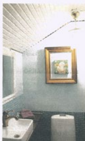
Kotimajoitus Kuuselan Wintin tilat on sisustettu vanhaa kunnioittaen.

– Lemmikkieläimetkin ovat tervetulleita. Yhden huoneen pyyrimme pitämään sellaisena, ettei sinne oteta lemmikkejä, Kesti kertoo.